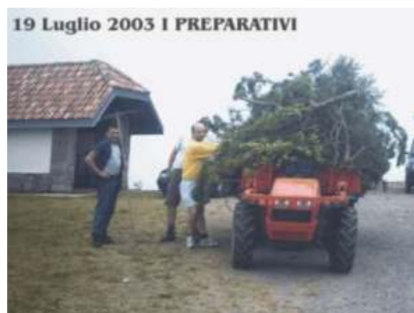
Monte Stino: Il giorno prima della Festa.

Un sentito grazie agli alpini, e non, che partecipano alle operazioni preliminari e conclusive delle feste.