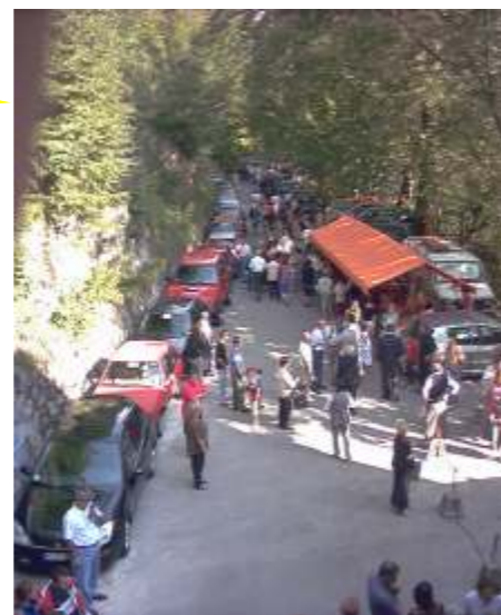
Rio Secco: Servizio d'Ordine.