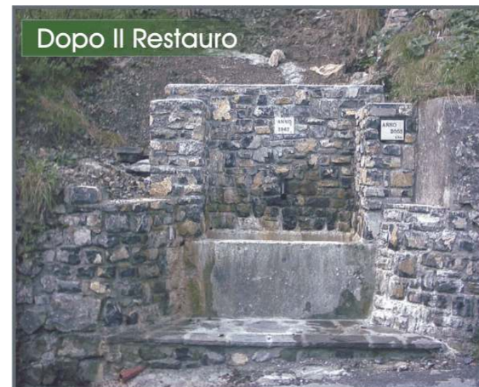
Dopo Il Restauro