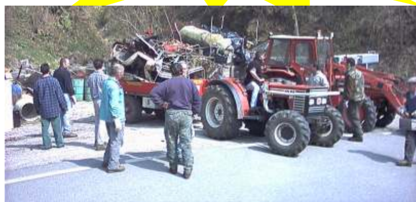
“Giornata Ecologica”: Ultima tappa al container.

“La collaborazione è il nostro punto di forza.”